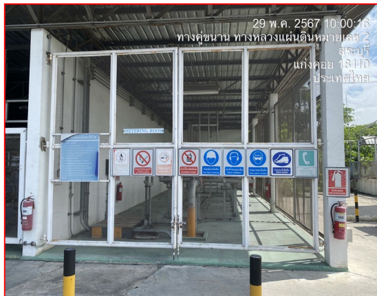
ป้ายเตือนความปลอดภัย