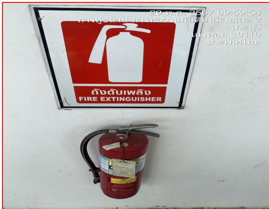
อุปกรณ์ดับเพลิง