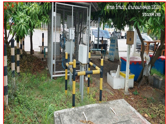
ป้ายเตือนแนวท่อส่งก๊าซฯ