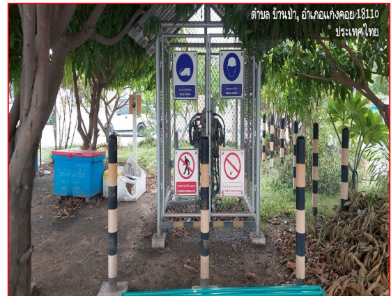
ป้ายเตือนแนวท่อส่งก๊าซฯ

ภาพที่ 3.2-1 ภาพถ่ายระบบรักษาความปลอดภัยบริเวณสถานีก๊าซโครงการท่อส่งก๊าซธรรมชาติไปยังสถานีบริการ NGV ของสมาคมขนส่งทางบกแห่งประเทศไทย พื้นที่ อ.แก่งคอย จ.สระบุรี